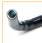
Sensor mit präziser Optik